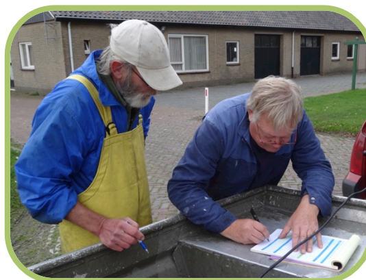
Sportvissers houden alle vangsten bij, zoals hier in Friesland bij het gemaal Roptazijl.

schieralen op. Daarmee kan het beheer in de toekomst verder worden fine-getuned.