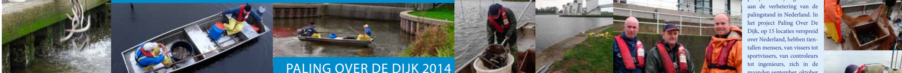
PALING OVER DE DIJK 2014